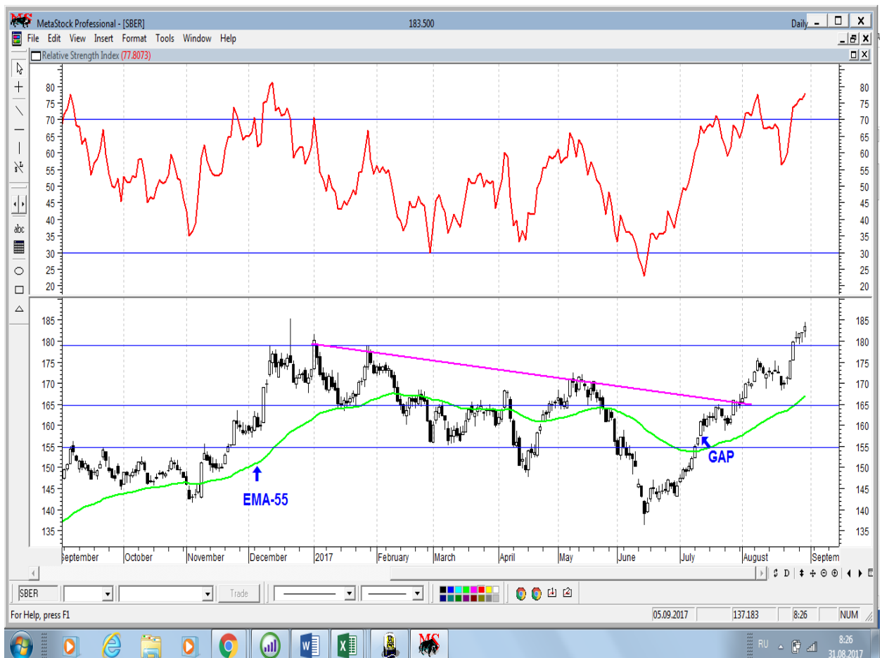
График акций Сбербанка

* Акции для сравнения с Портфелем УТ в прошлом цикле считаются купленными по средневзвешенным ценам 04.07.2017 г.