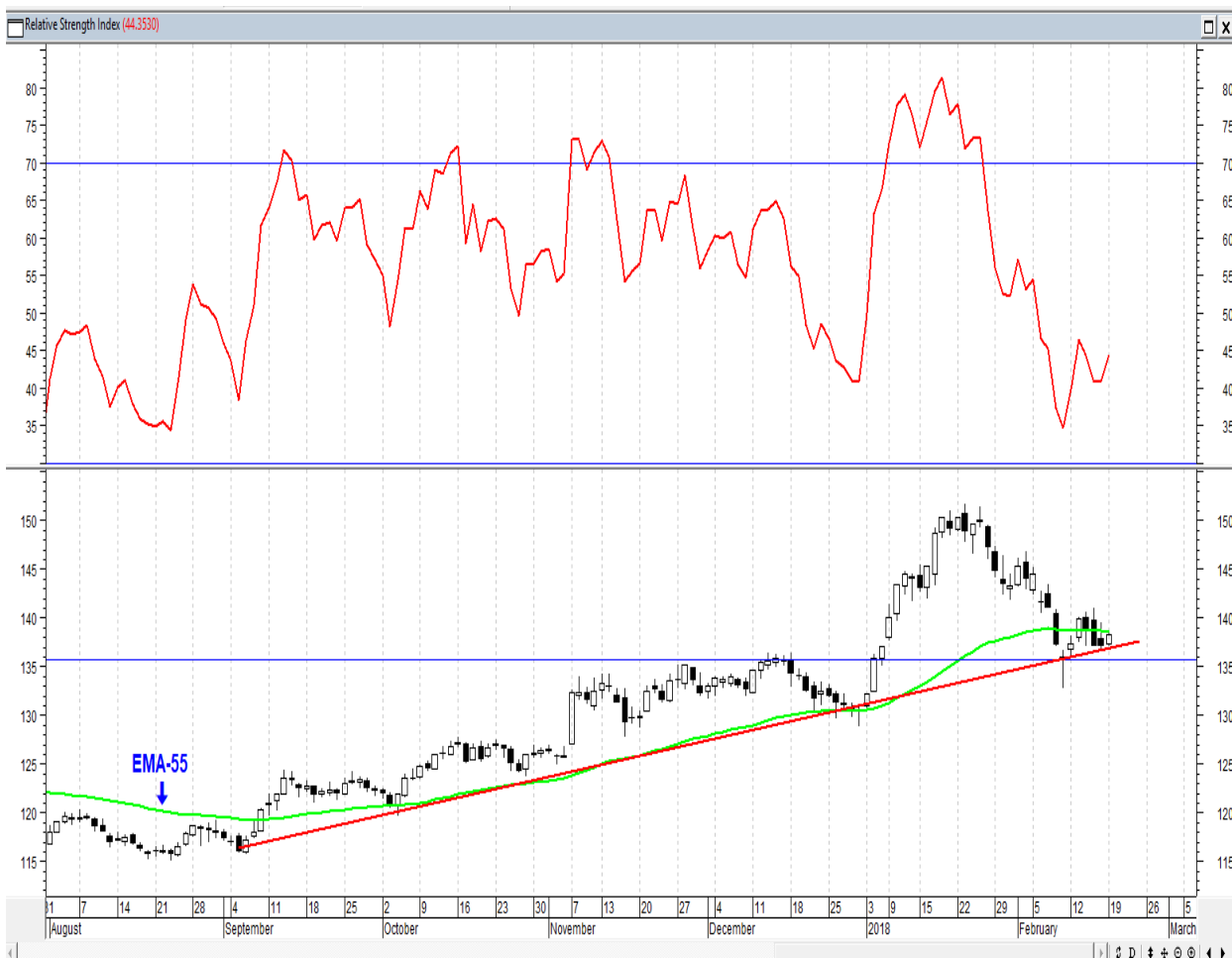
График акций ГМК НорНикель