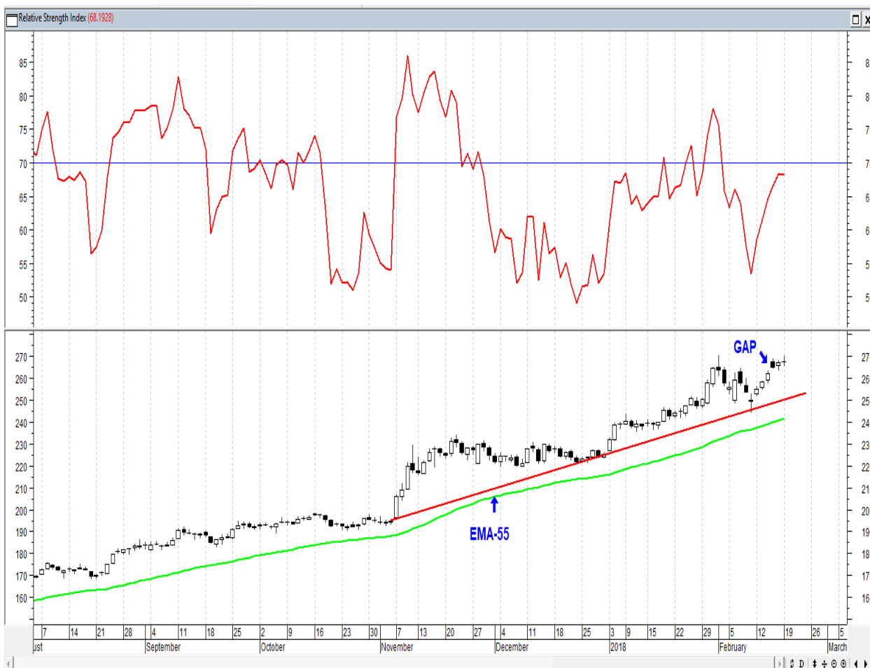
График акций Сбербанка

* Акции для сравнения с Портфелем УТ в прошлом цикле считаются купленными по средневзвешенным ценам 10.01.2018 г.