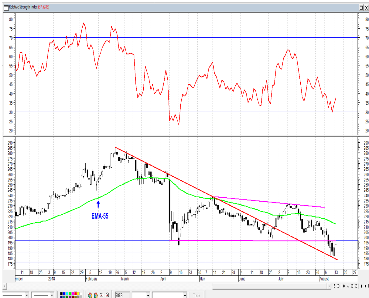
График акций Сбербанка

* Акции для сравнения с Портфелем УТ считаются купленными по средневзвешенным ценам 10.05.2018 г.