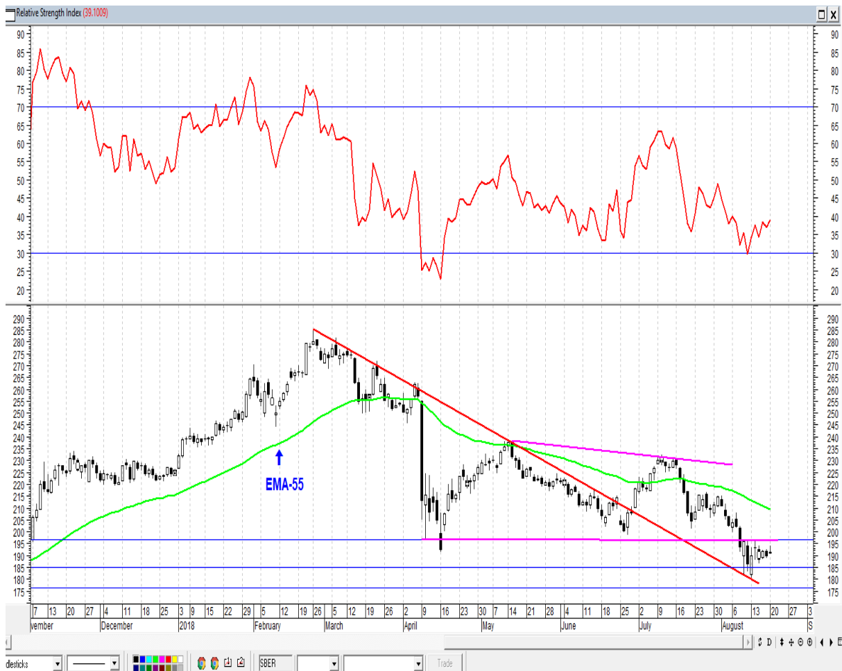
График акций Сбербанка

* Акции для сравнения с Портфелем УТ считаются купленными по средневзвешенным ценам 10.05.2018 г.