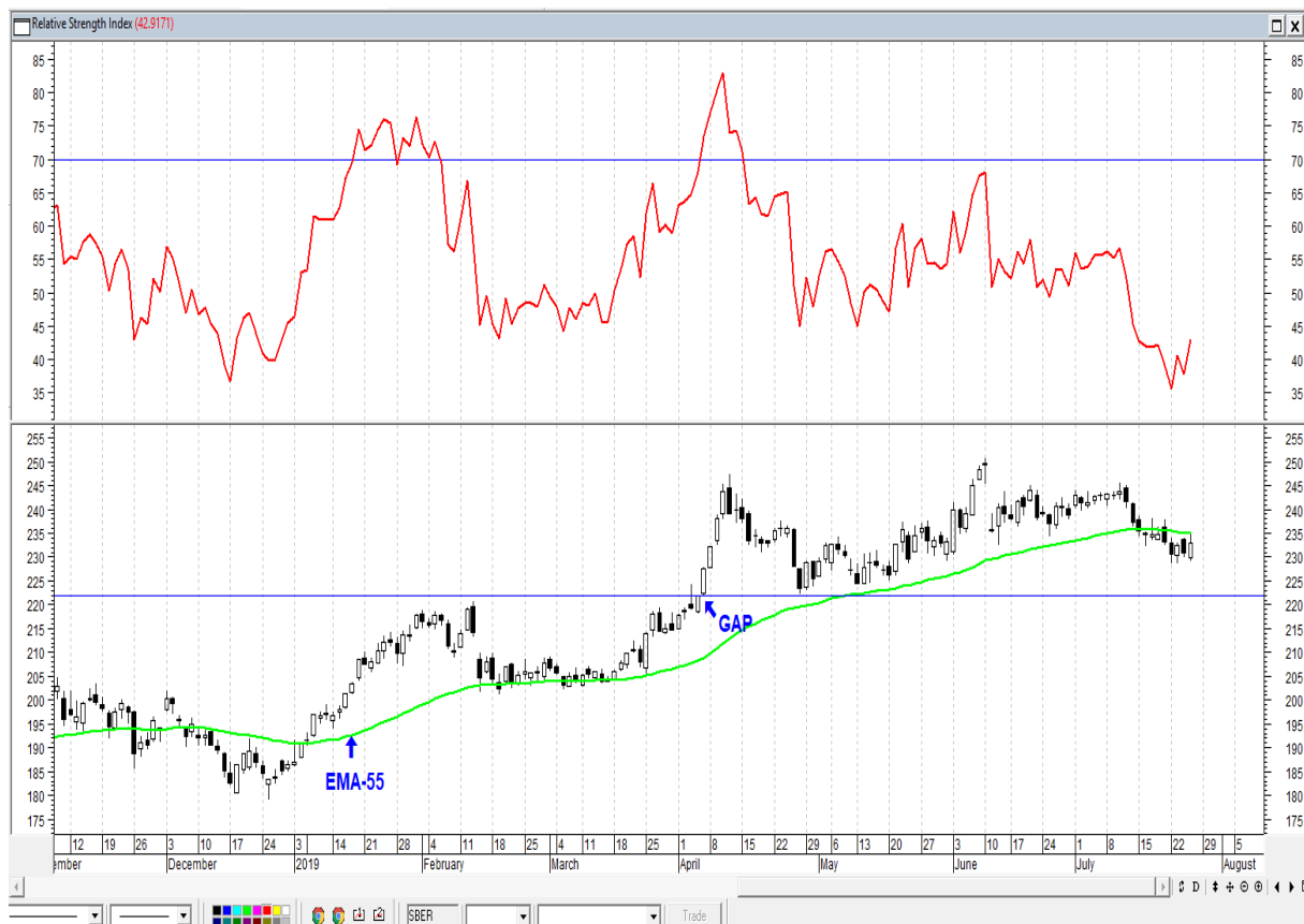
График акций Сбербанка

* Акции для сравнения с Портфелем УТ считаются купленными по средневзвешенным ценам 18.03.2019 г.